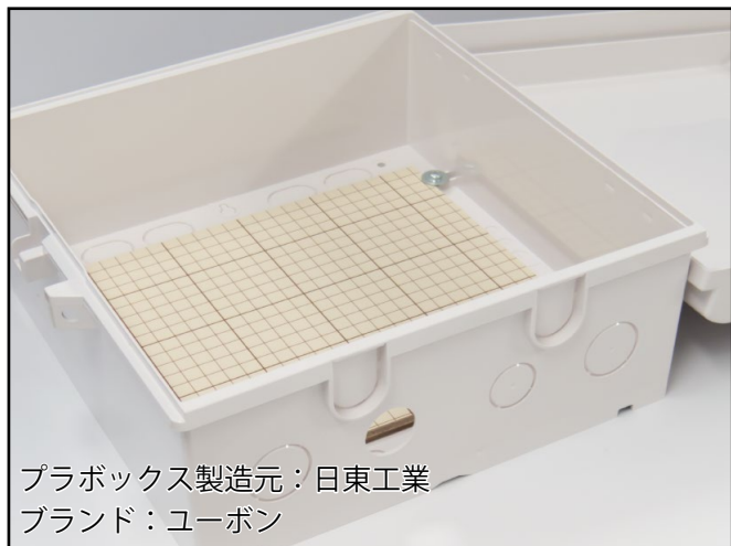
プラボックス製造元：日東工業 ブランド：ユーボン

日東工業製のプラボックス(P-A)にご指定の位置、寸法で穴あけ加工を行います。穴数や位置等の詳細については都度お見積りを行います。