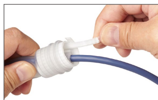
コネクタを抑えながらチューブの両端を引き抜く