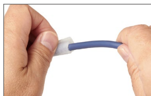
ケーブルの規定位置にテープを巻く