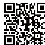
QRコードからYouTubeで作業手順の動画をご覧いただけます。